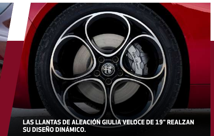
LAS LLANTAS DE ALEACIÓN GIULIA VELOCE DE 19" REALZAN SU DISEÑO DINÁMICO.