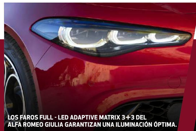
LOS FÁROS FULL-LED ADAPTIVE MATRIX 3+3 DEL ALFA ROMEO GIULIA GARANTIZAN UNA ILUMINACIÓN ÓPTIMA.