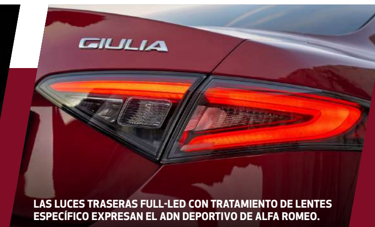
LAS LUCES TRASERAS FULL-LED CON TRATAMIENTO DE LENTES ESPECÍFICO EXPRESAN EL ADN DEPORTIVO DE ALFA ROMEO.