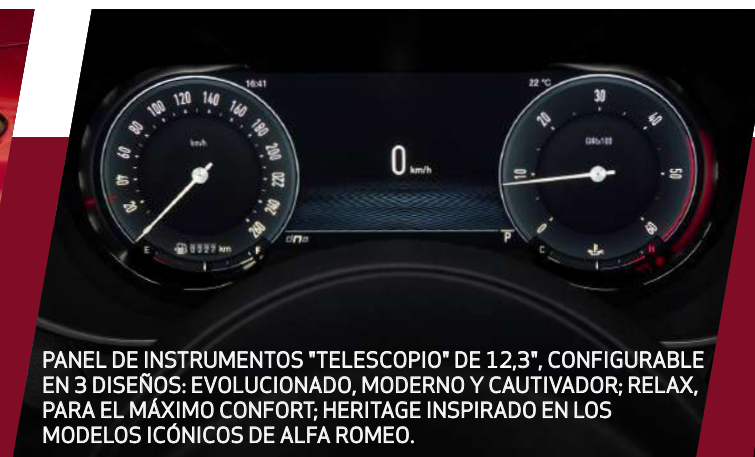
PANEL DE INSTRUMENTOS "TELESCOPIO" DE 12,3", CONFIGURABLE EN 3 DISEÑOS: EVOLUCIONADO, MODERNO Y CAUTIVADOR; RELAX, PARA EL MÁXIMO CONFORT; HERITAGE INSPIRADO EN LOS MODELOS ICÓNICOS DE ALFA ROMEO.