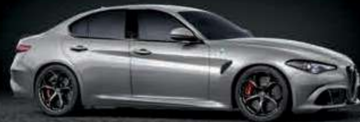
620 - GRIS SILVERSTONE