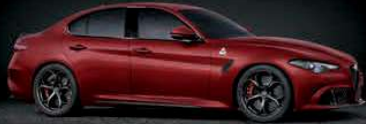
414 - ROJO ALFA