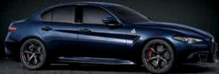
092 - AZUL MONTECARLO