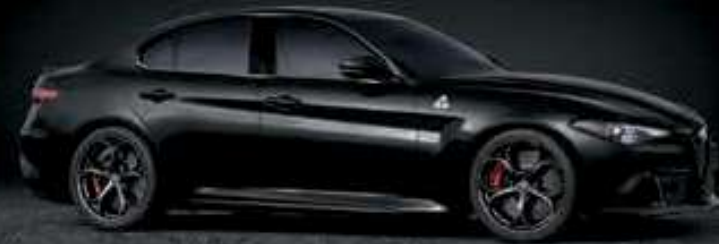
408 - NEGRO VULCANO