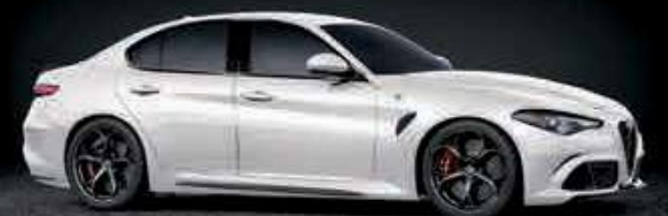
248 - BLANCO TROFEO