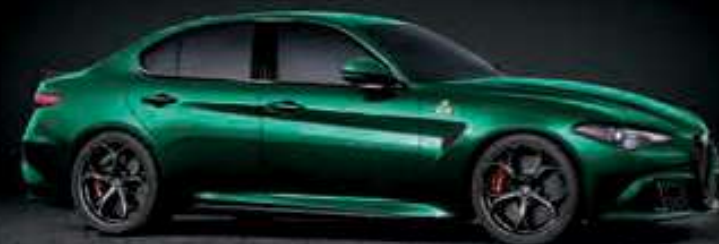
646 - VERDE MONTREAL