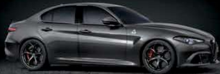
035 - GRIS VESUVIO