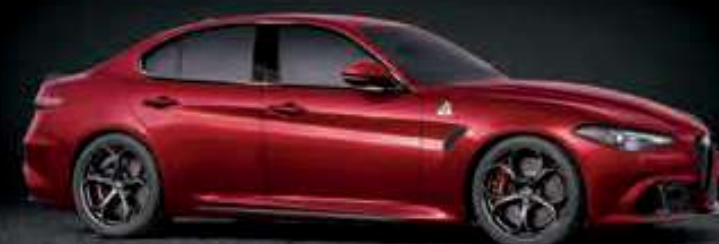
362 - ROJO COMPETIZIONE