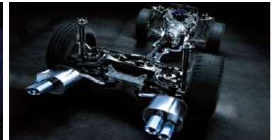
SISTEMA DE ESCAPE CONFECCIONADO EN TITANIO®