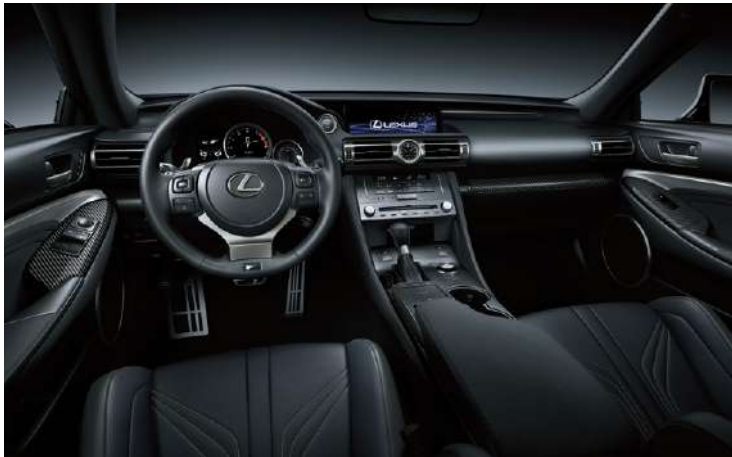
DETALLES EN EL INTERIOR CONFECCIONADOS EN FIBRA DE CARBONO (CFRP) Y ALCÁNTARA®