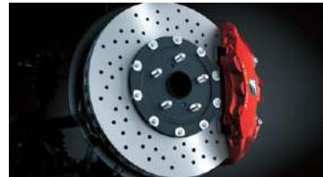
SISTEMA DE FRENOS BREMBO® CON CÁLIPER ROJO DISEÑO F