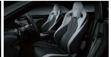
BUTACAS PERFORMANCE F TAPIZADAS EN CUERO SEMIANILINA