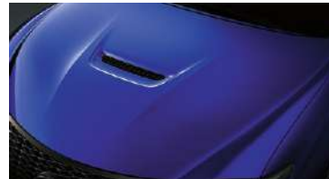
CAPOT CON TOMA DE AIRE