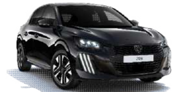
Negro Perla Nera