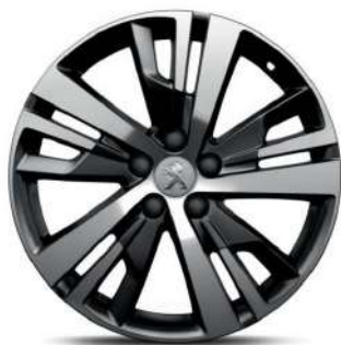
DETROIT 18" Active Pack