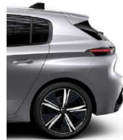
GT 18' Alloy Kamakura