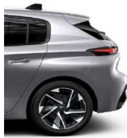
Allure Pack 17' Alloy Halong