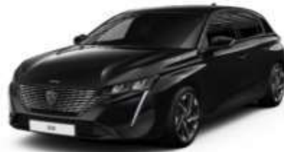
Perla Nera Black