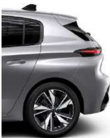
Allure 17' Alloy Calgary