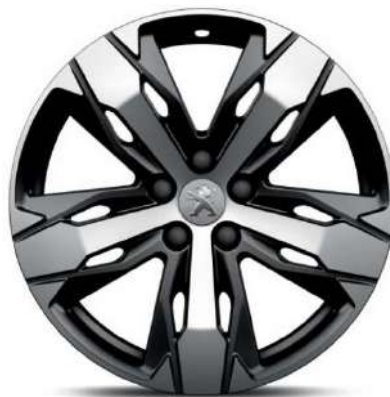
LOS ANGELES 18" Allure Pack /GT