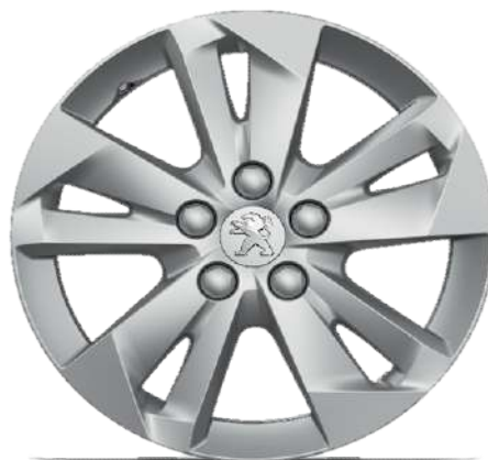
TARANAKI 15" Allure